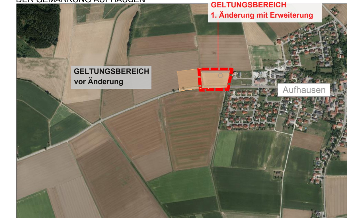
Übersichtslageplan, M 1:10.000

FLURNR.: 148, 148/2, 148/3, 307, 346/1 (TF, ST 2146) DER GEMARKUNG AUFHAUSEN